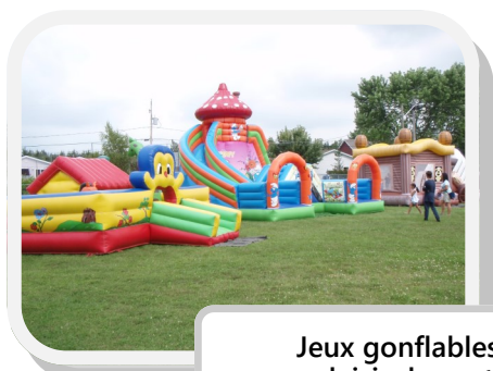
Jeux gonflables, au plaisir des petits.