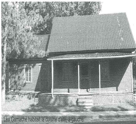
Léa Gamache habitait la cuisine d'été, à gauche

Maison où habite maintenant Réjean Dubé, Sylvie Moreau et leurs trois fistons.