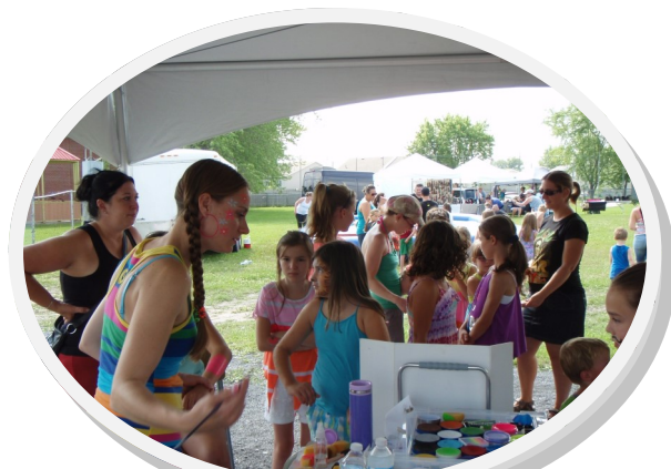
De beaux maquillages pour nos jeunes.