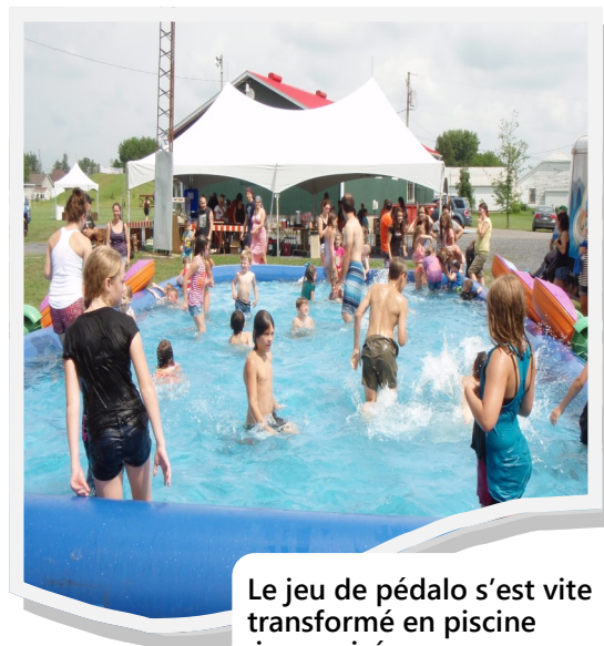
Le jeu de pédalo s'est vite transformé en piscine improvisée.