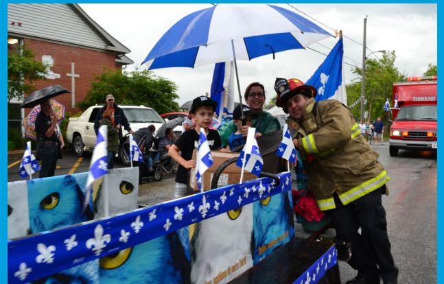
Un petit Saint-Jean-Baptiste bien entouré.