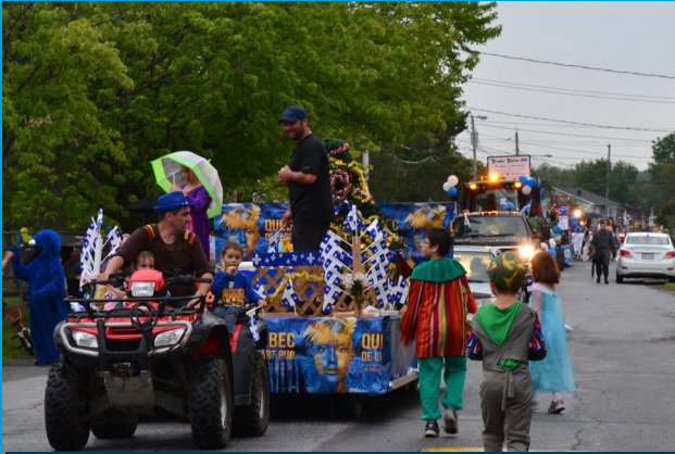
Beau temps mauvais temps, les petits et les grands étaient au rendez-vous pour le traditionnel défilé de chars allégoriques.