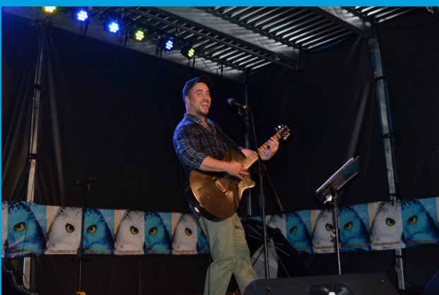
Malgré la pluie, on garde le sourire.