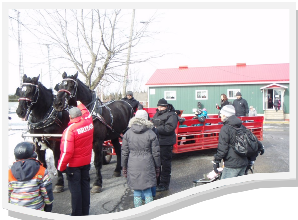
Les magnifiques chevaux n'ont pas eu beaucoup de repos durant la journée. La carriole était remplie et la file d'attente était au rendez-vous pour profiter de cette activité.

Merci à nos commanditaires, la Tête de Pioche, la Ferme Joalin et Poulet D'Amours et fils pour leur certificat-cadeau !