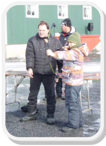
L'activité de tir à l'arc, présentée par Finition de Béton EPR inc. a été grandement appréciée par les enfants. Attention, nous avons d'excellents archers dans notre Municipalité!