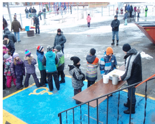
Les petits comme les grands ont profité de l'occasion pour se sucrer le bec avec l'excellente tire sur la neige de l'Érablière Meunier.